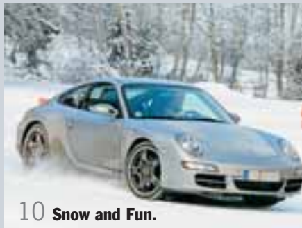
10 Snow and Fun.