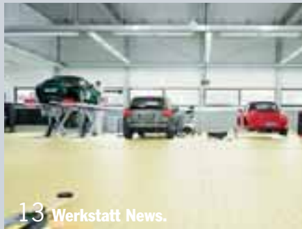
13 Werkstatt News.