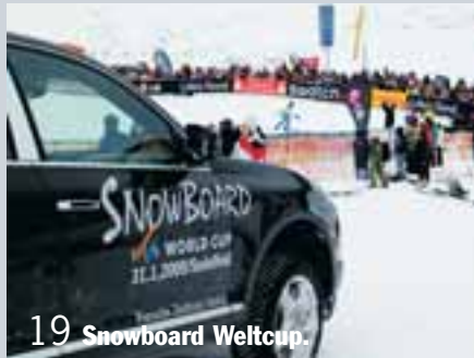
19 Snowboard Weltcup.